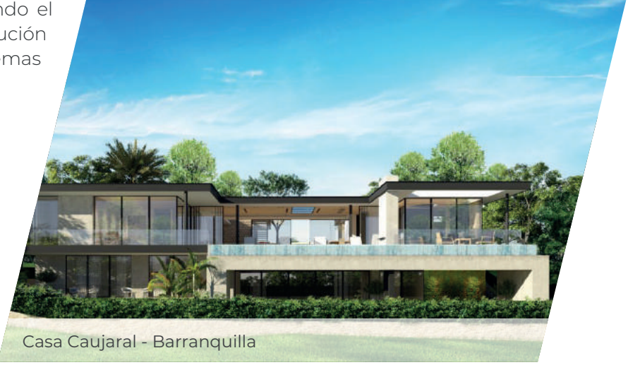
Casa Caujaral - Barranquilla