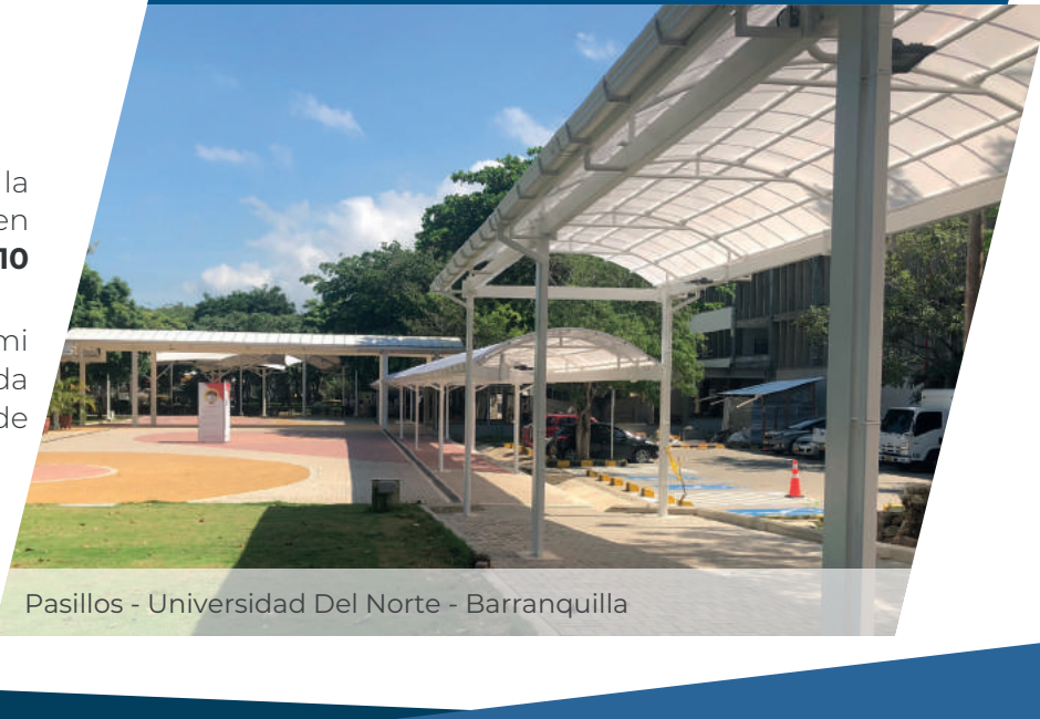
Pasillos - Universidad Del Norte - Barranquilla

En J&E ESTRUCTURAS llevamos a cabo la fabricación de estructuras metálicas teniendo en cuenta los requisitos de la norma NSR-10 (Construcciones sismo resistentes). Contamos con equipos de fabricación en semi automáticos, brindando agilidad y calidad en cada uno de los procesos, asegurando el control de calidad durante los procesos de fabricación.