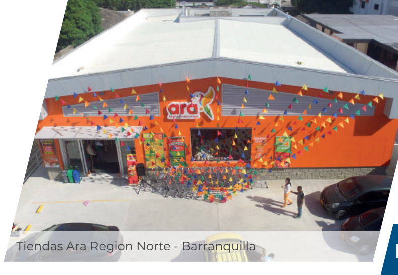
Tiendas Ara Region Norte - Barranquilla