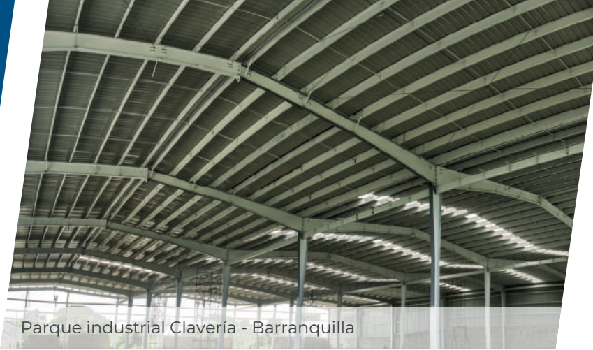
Parque industrial Clavería - Barranquilla

ESTRUCTURAS J&E es una empresa dedicada al Diseño, Fabricación y Montaje de estructuras metálicas, apoyados con la mejor tecnología. Contamos con personal altamente calificado y una planta de fabricación de 2.500 m 2 , ubicada en Soledad (Atlántico), con capacidad de ejecución de proyectos para el mercado nacional e internacional.