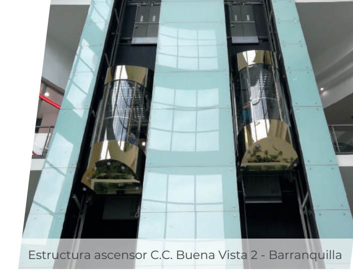
Estructura ascensor C.C. Buena Vista 2 - Barranquilla

Desarrollar el diseño, fabricación y montaje de estructuras metálicas para todo tipo de proyectos de construcción, trabajando estratégicamente con arquitectos, inversionistas y/o constructores, apoyándonos en el uso de la mejor tecnología, profesionalismo de nuestro grupo de trabajo, buenas prácticas y cumplimiento de las normas vigentes requeridas.