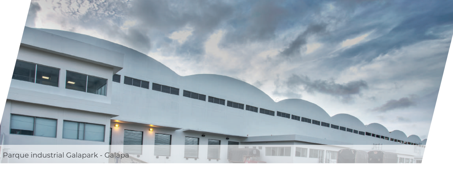
Parque industrial Galapark - Galapa